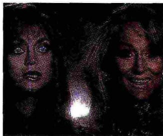
Grottesco Goldie Hawn e Meryl Streep nel film di Robert Zemekis «La morte ti fa bella», sui ritocchi estremi