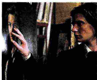
Illusione Ben Barnes nel film di Oliver Parker «Dorian Gray» (2009), ispirato all'ossessione protagonista del romanzo di Oscar Wilde