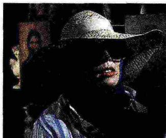
Finzione Marthe Keller nel film di Billy Wilder «Fedora» (1978) dove un'ex famosa attrice rifiuta il tempo che passa