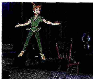
Fanciullezza Una scena tratta dal film «Le avventure di Peter Pan» di Disney, basato sull'opera teatrale «Peter e Wendy» di J. M. Barrie